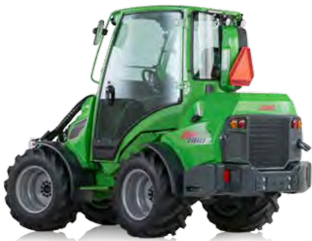
Höhe mit Kabine 2230 mm